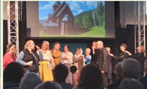
Afbeelding: fotocollage 'As it is in Heaven'.