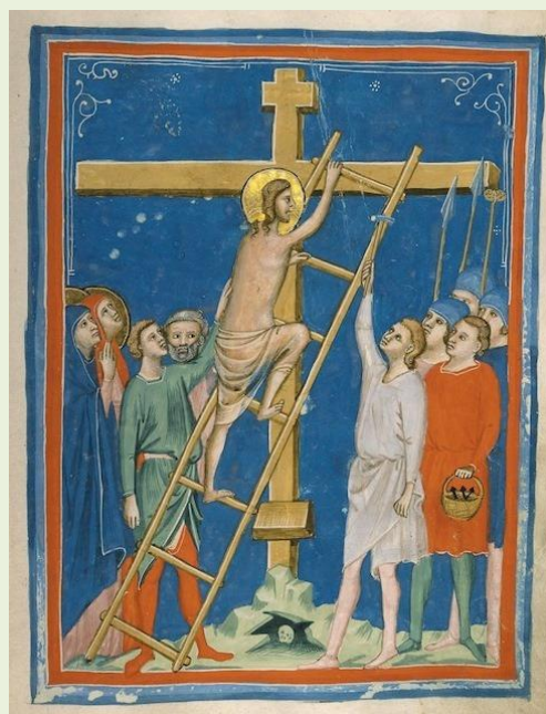
Afbeelding: Italië, Pacino di Bonaguida X'AscentCross.

Na de presentatie was er, naar goed gebruik bij Duifjes, gelegenheid om samen wat te drinken en met elkaar te delen wat door ieder aan eten was meegebracht.