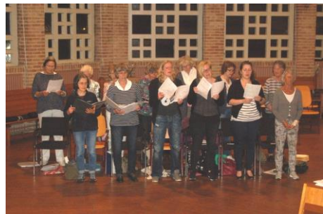
alten – bassen+tenoren – sopranen