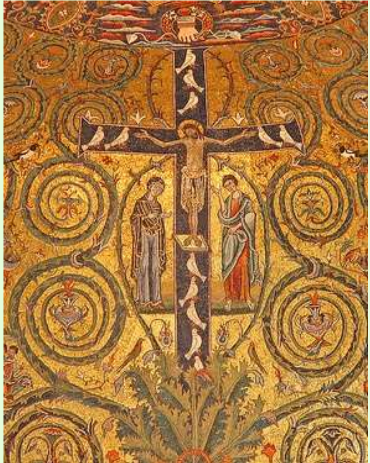
Kruis als levensboom San Clemente in Rome, 13 de eeuw

groeten elkaar en de schepping in Gods licht