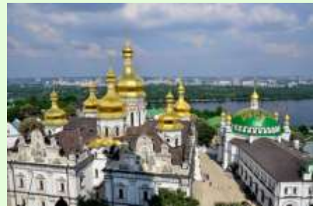
Het Hokenklooster van Kiev, zetel van de Oekraïens-Orthodoxe Kerk onder het patriarchaat van Moskou

De kerk met de oudste wortels is de Oekraïens-Orthodoxe kerk onder de patriarch van Constantinopel. (het huidige Istanboel). Aan het hoofd staat een metropoliet. Deze kerk kan zich erop beroepen dat zij teruggaat tot de ontstaansgeschiedenis van de kerk in de Oekraïne. Dat was rond het jaar 1000 in wat toen het vorstendom rond Kiev was, Rusland zou pas eeuwen later ontstaan. De vorst (en daarmee de bevolking) liet zich dopen. De kerk die ontstond viel onder de patriarch in Constantinopel, centrum van het Oost-Romeinse Rijk. Vorsten en kerkleiders uit die begintijd waren opvallend vrede- en menslievend. Abt Theodosius van het Grote Hokenklooster in Kiev (†1074) zocht de eenvoud die ook Franciscus van Assisi kenmerkte. Prins Vladimir (1113-1125) verbood op grond van de bijbel de doodstraf, verminking als straf en foltering. Zijn twee zoon, Boris en Gleb gingen in het voetspoor van hun vader. Zij vonden de dood omdat ze zich niet wilden verweren tegen een familielid die de troon wilde veroveren. Aan de bloeitijd van Kiev kwam in 1237 een eind door de verwoesting van de stad door de Mongolen.